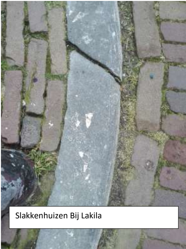
Slakkenhuizen Bij Lakila