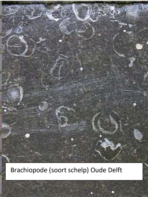
Brachiopode (soort schelp) Oude Delft