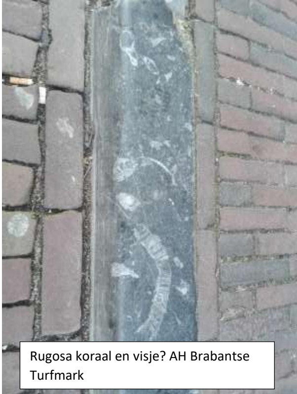
Rugosa koraal en visje? AH Brabantse Turfmark